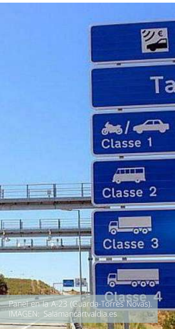
Panel en la A-23 (Guarda-Torres Novas).