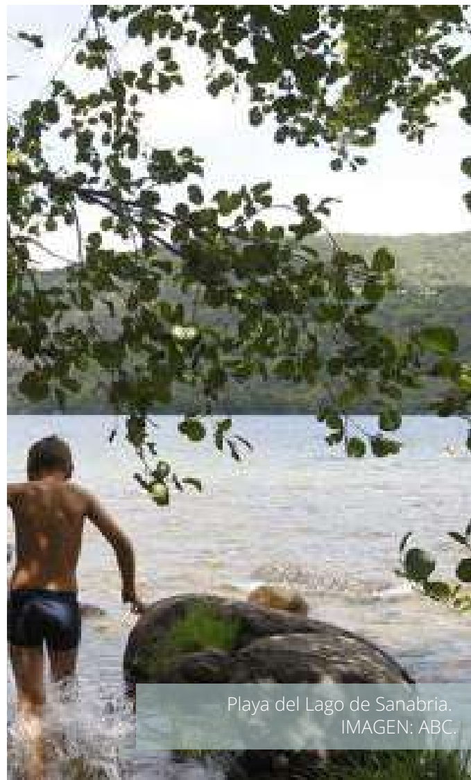
Playa del Lago de Sanabria. IMAGEN: ABC.

CAMPAÑA "Inspira" en prensa IMAGEN: Cadena SER.