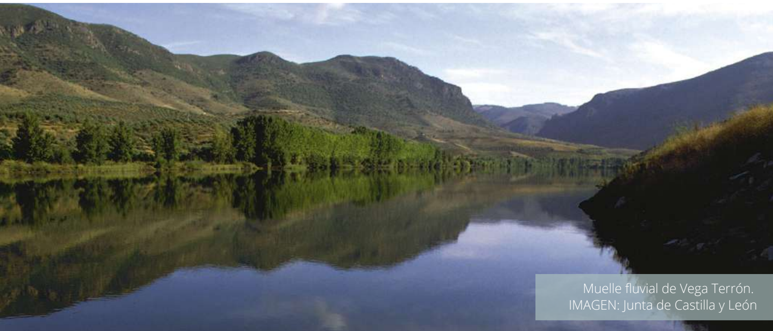
Muelle fluvial de Vega Terrón.

La temporada de cruceros que parten desde el muelle salmantino de Vega Terrón se da prácticamente por perdida