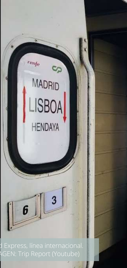
Sud Express, línea internacional.

La medida afecta, entre otras, a carreteras bien conocidas por los castellano y leoneses, pues son las que utilizan para acceder al litoral centro-norte y Oporto (A-25 Vilar Formoso-Aveiro) o hacia el litoral centro-sur y Lisboa (A-23 Guarda-Torres Novas). La A-24 comienza al norte de Viseu hasta la frontera con Galicia.