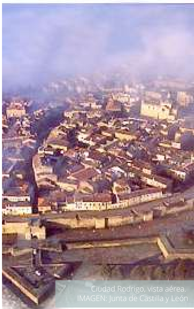
Ciudad Rodrigo, vista aérea.